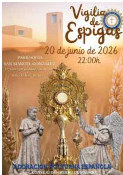
Portada: Cartel Vigilia de Espigas