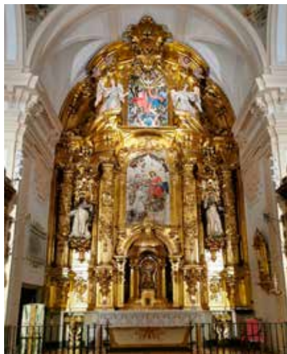
Portada: Retablo Mayor Convento Trinitarias Descalzas de san Ildefonso - Madrid MANUEL MESA - s. XVIII