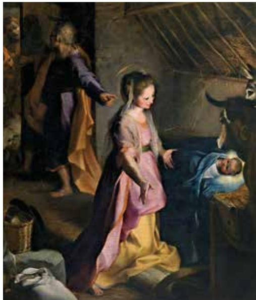
Portada: La Natividad Federico Barocci (1535-1612) Museo del Prado