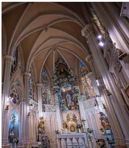
Portada: Capilla del Santísimo Iglesia «Cachito de Cielo»