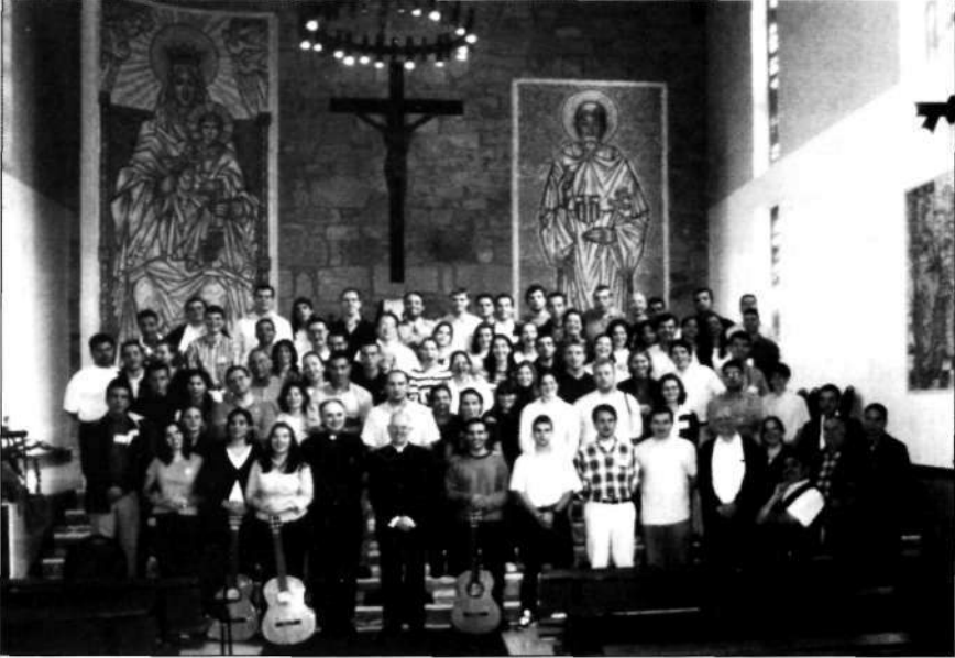
Los noventa jóvenes asistentes, tras la Eucaristía presidida por el Excmo. Sr. Arzobispo de Santiago de Compostela