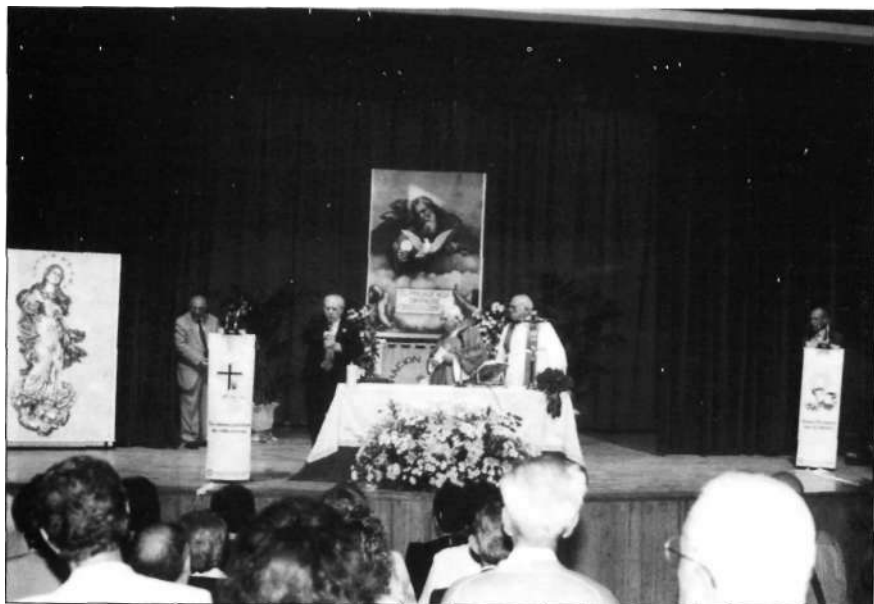
La celebración eucarística en el último día del Simposio

Compostela, pronunció la conferencia de clausura: "Luis de Trelles ¿un santo para hoy?" .