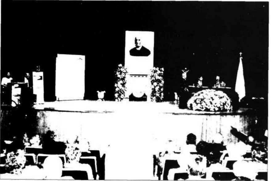
Una de las mesas redondas