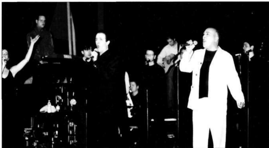
Uno de los cuadros musicales: "Es nuestra Historia"