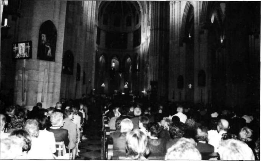
Vista de la nave central de la Catedral, repleta de adoradores

la filosofía de Nietzsche es la misma en la que se descubriría el entrañable misterio del Sagrado Corazón de Jesús... eran los tiempos de Santa Teresa de Lisieux, de León XIII. En este clima nacía... la A.N.E. con aquellos hombres que apostaban por un hombre que necesita conversión, misericordia, perdón, redención y gracia... que necesita amor, un verdadero amor de Dios... no había otro camino que llevar al Corazón Sacramentado