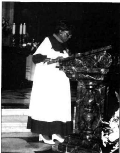
La Presidenta de la A.N. de Malabo, en su intervención en la Eucaristía

sacrificio para los que hubieron de permanecer en pie pues, aclaró: "Por razones de seguridad y buen orden, no era aconsejable instalar más sillas." Concretando, la Catedral de Madrid había llegado al máximo de una prudente ocupación.