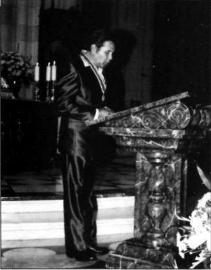
El Presidente Diocesano de Los Angeles (California), proclama una lectura en la Misa de la Vigilia