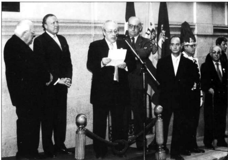
Un momento del acto inaugural de la placa conmemorativa