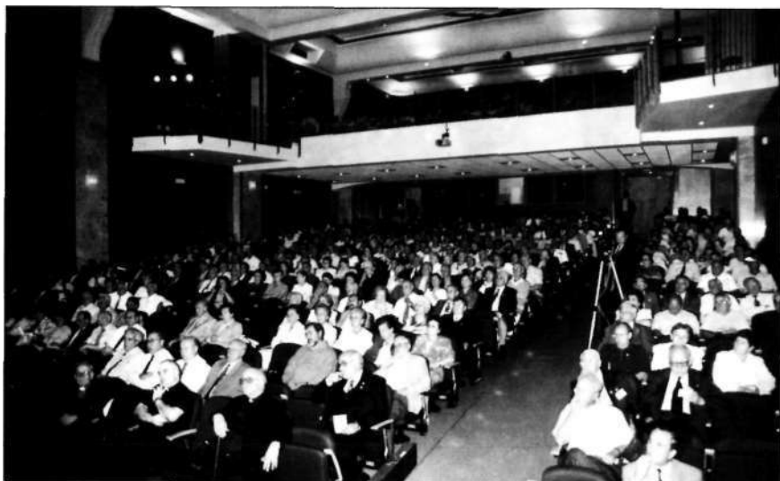
Aspecto del salón de actos del Colegio Maravillas, en la primera sesión de la Asamblea