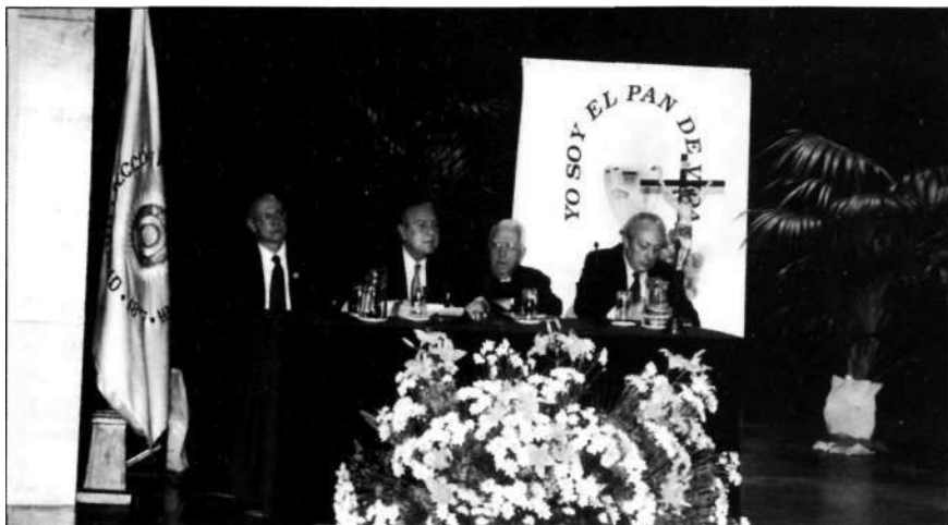
Ultima sesión de la Asamblea

informativos; el Vicepresidente Nacional 2° y Presidente de la Sección del Tibidabo, y después el Director Espiritual de esta Sección, nos invitaron a la Gran Vigilia Nacional que se celebrará en este Templo Nacional Expiatorio, con motivo de su centenario; y la Vocalía de Juventud puso una nota ilusionada con el eslogan " 125 años de historia, 1000 años de futuro".