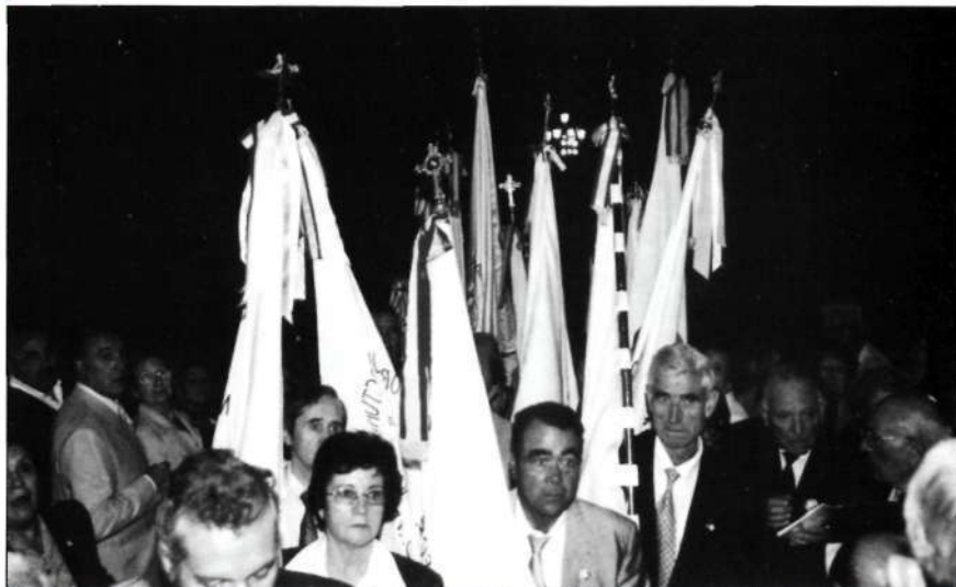
Doscientas ochenta banderas, testimoniaron por las calles de Madrid, la presencia de 4000 adoradores