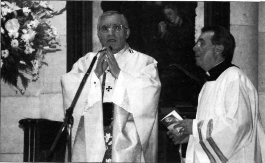
El Cardenal Ronco, preside la Eucaristía

premura y Exposición, en el transcurso de la cual las lecturas preceptivas las hicieron, protocolariamente, el Presidente Nacional de la A.N.E. y la Presidenta de la A.N.F.E. Antes de dar su bendición, el Cardenal leyó el mensaje del Santo Padre que figura en este boletín.