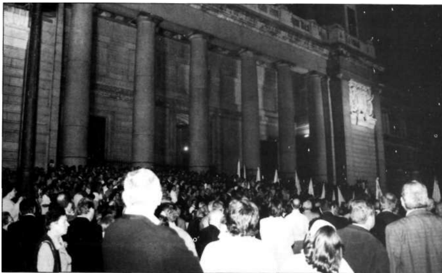
La procesión de banderas llega a la Almudena