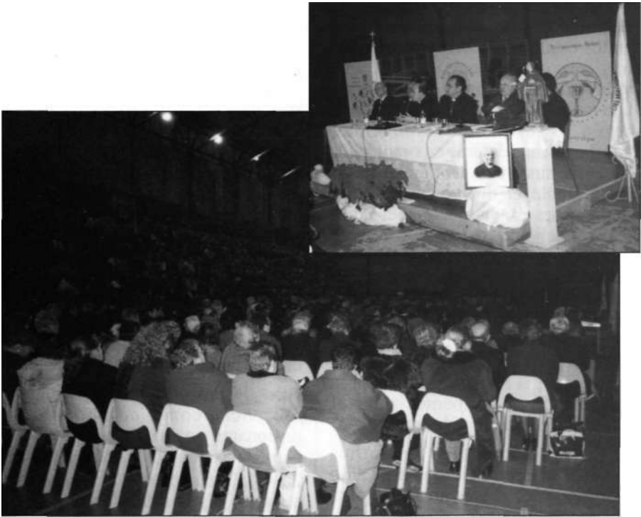
"La gran asistencia de adoradores de la región, desbordó todas las previsiones y fue preciso habilitar el pabellón deportivo". En la composición fotográfica, aspecto del recinto y mesa presidencial.

("Aprended de mí, que soy manso y humilde de corazón..."). Su fidelidad al plan de Dios ("Apártate de mí, Satanás..."). Su capacidad de perdonar y pedir perdón para sus enemigos ("Padre, perdónales..."). Su permanente disposición para aceptar la voluntad del Padre ("Yo para eso he venido..."). Su ilimitada confianza en Dios ("Padre, a tus manos encomiendo mi espíritu"). Estos son los rasgos de esa personalidad que, en cuanto adoradores cristianos, hemos de forjar con la ayuda del