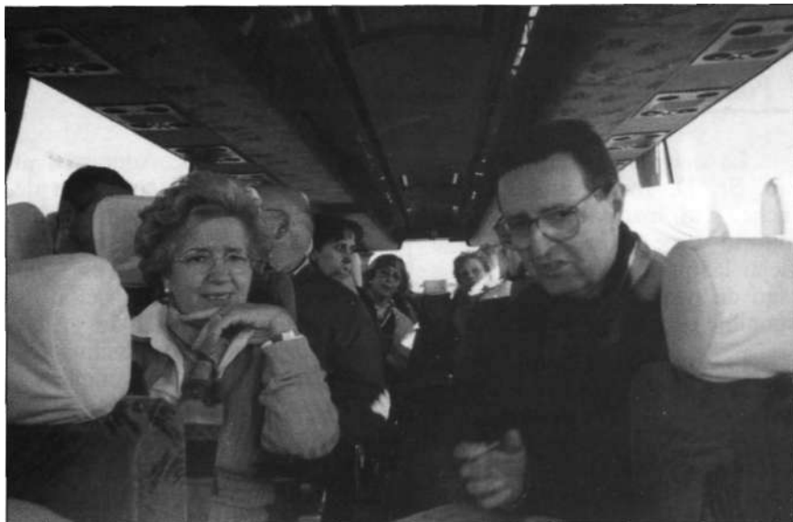
La salida de 180 adoradores de Madrid, en cuatro autocares, tuvo carácter de peregrinación.