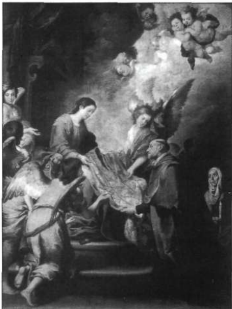
Imposición de la caxalla a san Ildefonso BARTOLOMÉ ESTÉBAN MURILLO (1618-1682) Museo del Prado (Madrid)

Defensor implacable de la perpetua virginidad de Maria