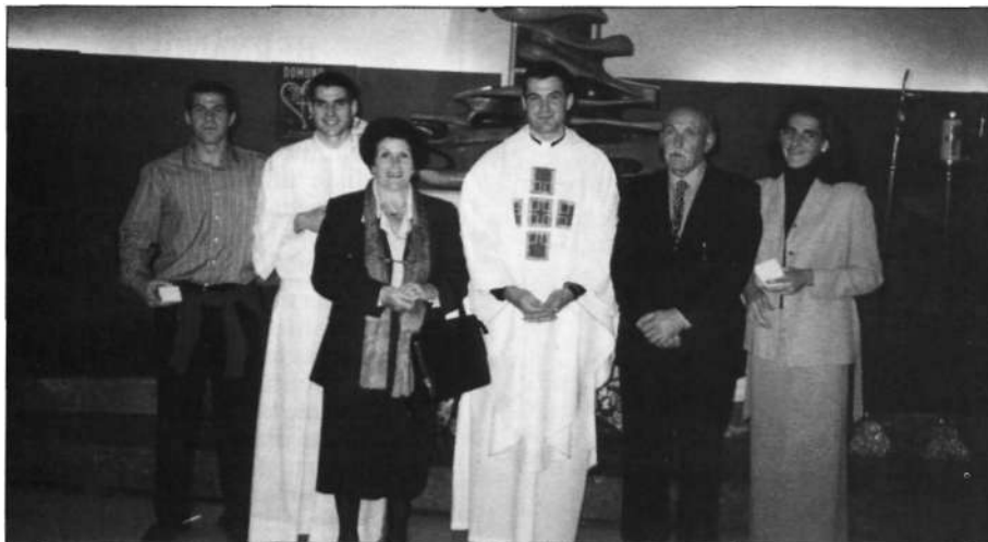
El nuevo sacerdote, junto a sus padres