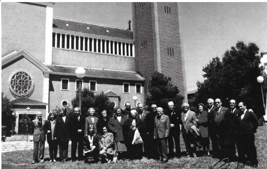
Los adoradores que componen actualmente el turno de Santa Gema, posan ante su Santuario