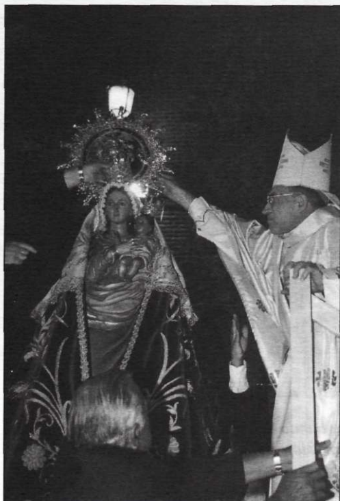
El Cardenal Rouco ciñe la corona a la Sagrada Imagen