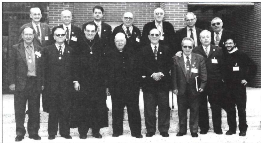
Componentes del Consejo saliente