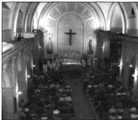
El templo repleto de adoradores.

No podemos dejar de recordar, aunque sea brevemente, por el impacto que causó en este cronista y, me consta que en muchos de los asistentes, las procesiones con las que se inició y finalizó la Vigilia. Estas pudieron celebrarse gracias a que, milagrosamente, la lluvia que no había parado de caer en toda la jornada, cesó en esos momentos precisos, permitiendo el testimonio de cientos de adoradores orando por las calles, acompañando al Señor en la custodia y a la imagen de su Santa Madre. No cabe ninguna duda de que los Sagrados Corazones de Jesús y María cuyas festividades celebramos en esos días, per-