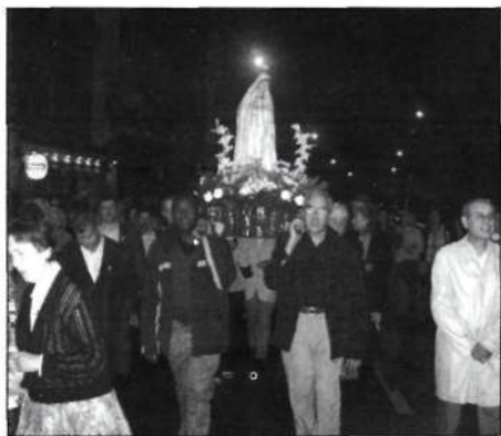
Nos acompañó la Virgen.