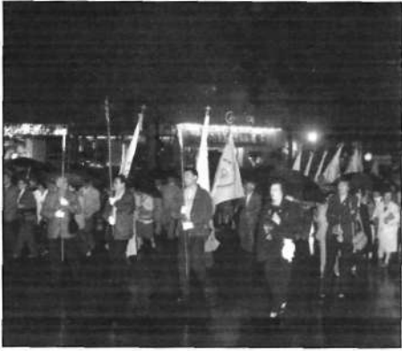
La procesión de banderas.

L AS crónicas que se escriben habitualmente sobre las distintas actividades que se organizan en la Adoración Nocturna Española - inauguraciones, encuentros de zona, Vigilias de Espigas - suelen centrarse en los actos del día: se resumen los datos de asistentes, el contenido de conferencias, homilías, etc. Pero casi siempre nos olvidamos de un aspecto fundamental de estas actividades, que se desarrolla en los meses, semanas y días antes de la celebración. Me refiero, a la preparación y organización de los actos.