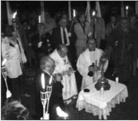
El Señor sobre el altar del parque.

ha hecho a lo largo de estos cincuenta años con los adoradores de la Sección de Fátima; y también a la Santísima Virgen que nos acogió bajo su manto y preparó nuestro corazón para el encuentro con su Hijo. Gracias a los sacerdotes de la Parroquia por todas las facilidades dadas a la organización de la Vigilia, por su compañía y ánimo y por el ejemplo de fe. Gracias también a los adoradores de la Sección de Fátima por la acogida, por la alegría y las atenciones: en una noche muy poco apacible nos hicieron sentir como en casa. Es obligado, asimismo, agradecer a la Junta Municipal de Distrito y a la Policía Municipal el servicio prestado y las facilidades para la realización de las procesiones. Finalmente, el