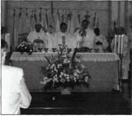
La Eucaristía y al fondo las banderas.