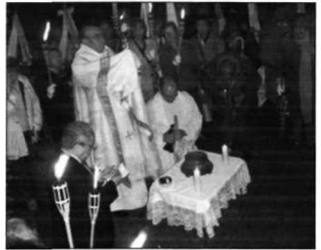
Jesús Sacramentado bendice a los campos y a las ciudades.