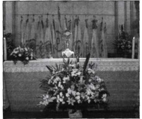
El Señor en la custodia para la adoración.

Es obligado antes de finalizar esta crónica dedicar un espacio, nunca suficiente, a los agradecimientos. En primer lugar a Dios, Nuestro Señor que nos ha convocado nuevamente a su presencia y nos ha dado la fuerza necesaria para responder a esta llamada, como lo