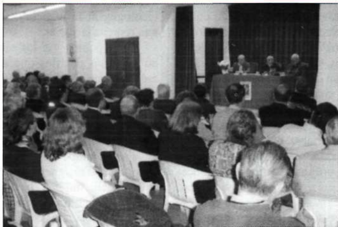
Más de 100 adoradores siguen con atención la conferencia.