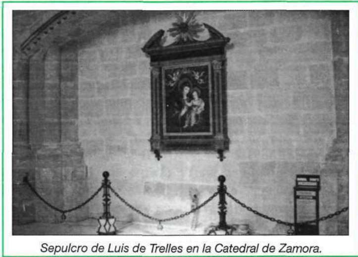
Sepulcro de Luis de Trelles en la Catedral de Zamora.