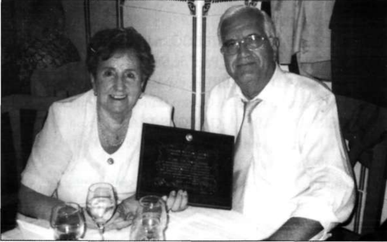
El homenajeador junto a su esposa.