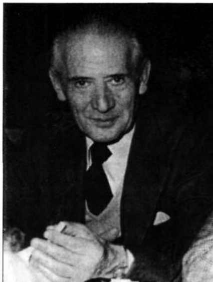
Siervo de Dios Pedro Herrero