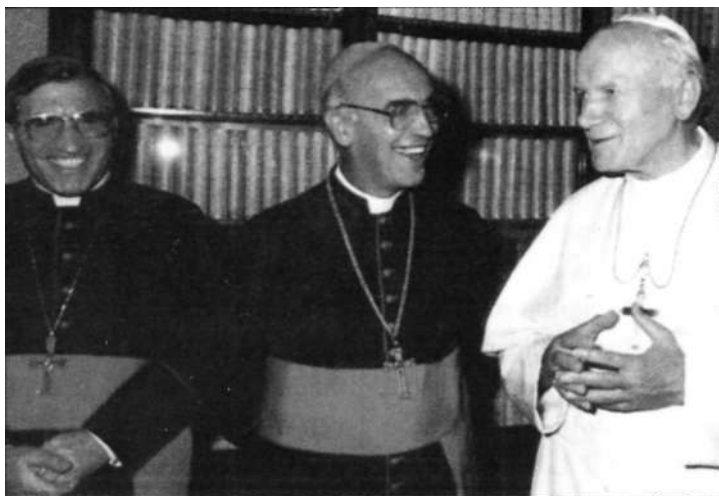
En el centro, el cardenal don Ángel Suquía, flanqueado por monseñor Rouco Varela y por el también fallecido Papa Juan Pablo II