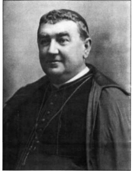
Beato Manuel González