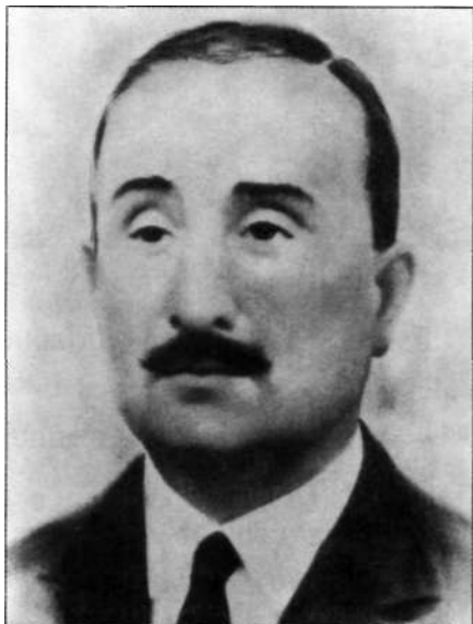
Beato Vicente Vilar