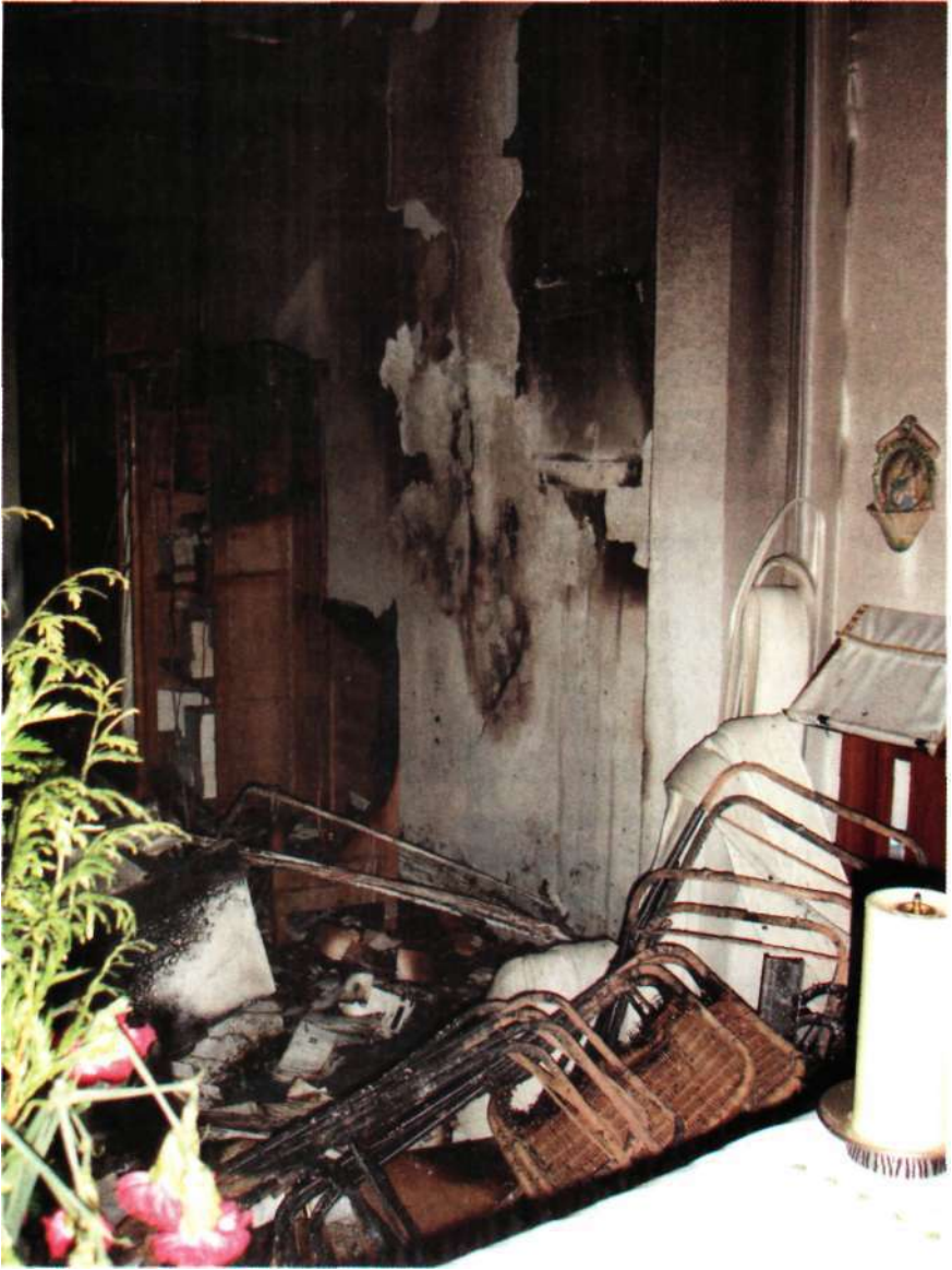
VISTA PARCIAL DEL SALÓN Y CAPILLA TRAS EL INCENDIO