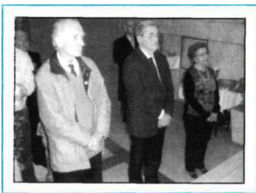
Los tres veteranos