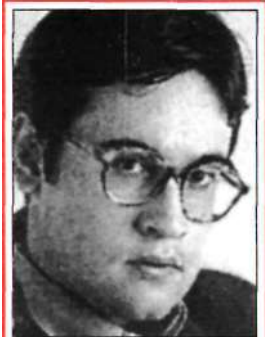
Juan Manuel de Prada

En el diario ABC de fecha 12 de junio de 2004, Juan Manuel de Prada publicaba el artículo, que reproducimos a continuación, y en el que ofrece públicamente un testimonio de la fe que profesa.