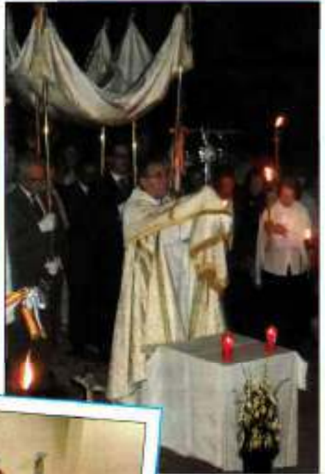
El Señor bendice los campos y la ciudad