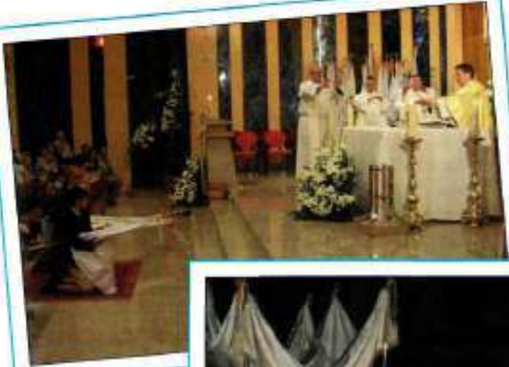
La nueva bandera se rinde en la Consagración