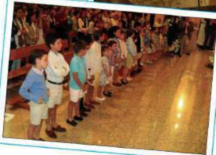
Señor, ¡aquí estoy!