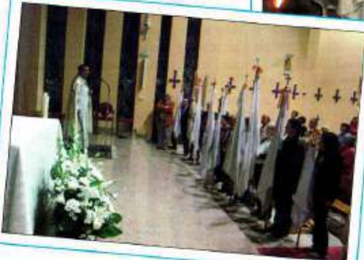
El Párroco, con emocionadas palabras, despide a los asistentes