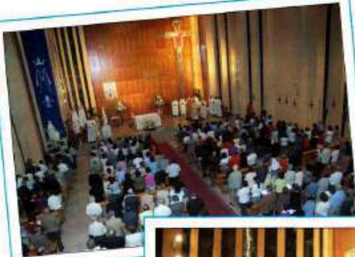
...El Templo pronto se llenó de fieles