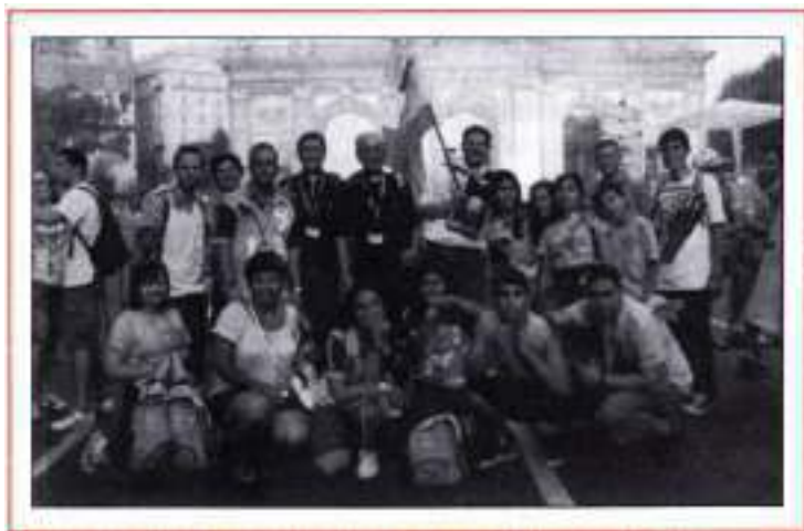
Jóvenes de la JMJ ante la Puerta de Alcalá

vocación, al comprobar los frutos producidos (según la encuesta de la consultora GAD3, el 81% de los participantes reconoce haber reforzado su relación con Dios, y el 55% afirma haber avanzado en el discernimiento de su vocación). Yo también puedo dar testimonio de más de un sacerdote y religioso que había juzgado críticamente la JMJ y que había optado por no implicarse en su convocatoria, que se ha sentido positivamente «tocado» por una juventud admirable. Uno de ellos decía: «He visto de cerca a estos jóvenes, y tengo que reconocer que fuimos injustos al acusarlos de papalatría».