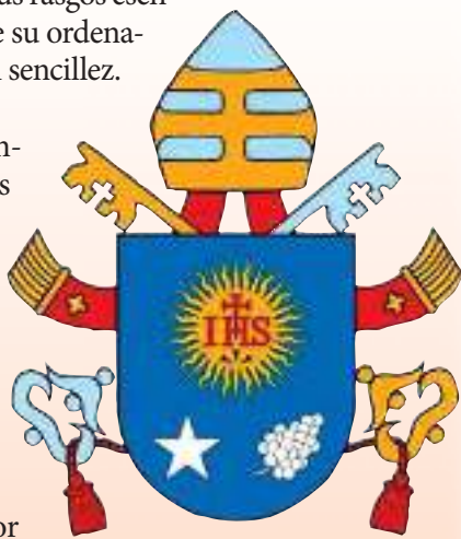
miserando atque eligendo

El escudo, de azul, está rematado por los símbolos de la dignidad pontificia, iguales a los que escogió su antecesor Benedicto XVI (mitra colocada entre sendas llaves de oro y de plata, dispuestas en forma de cruz y unidas por un cordón rojo). En el centro del escudo, descuella el emblema de la orden de la que procede el Papa, la Compañía de Jesús: un sol radiante y llameante cargado de las letras «IHS», monograma de Cristo, de gules. La letra H está rematada por una cruz; en la punta, los tres clavos, de sable.